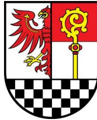
Wappen des Landkreises