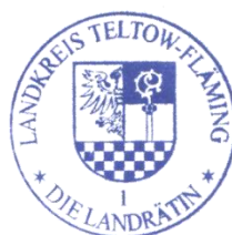
Dienstsiegel des Landkreises