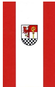
Flagge des Landkreises